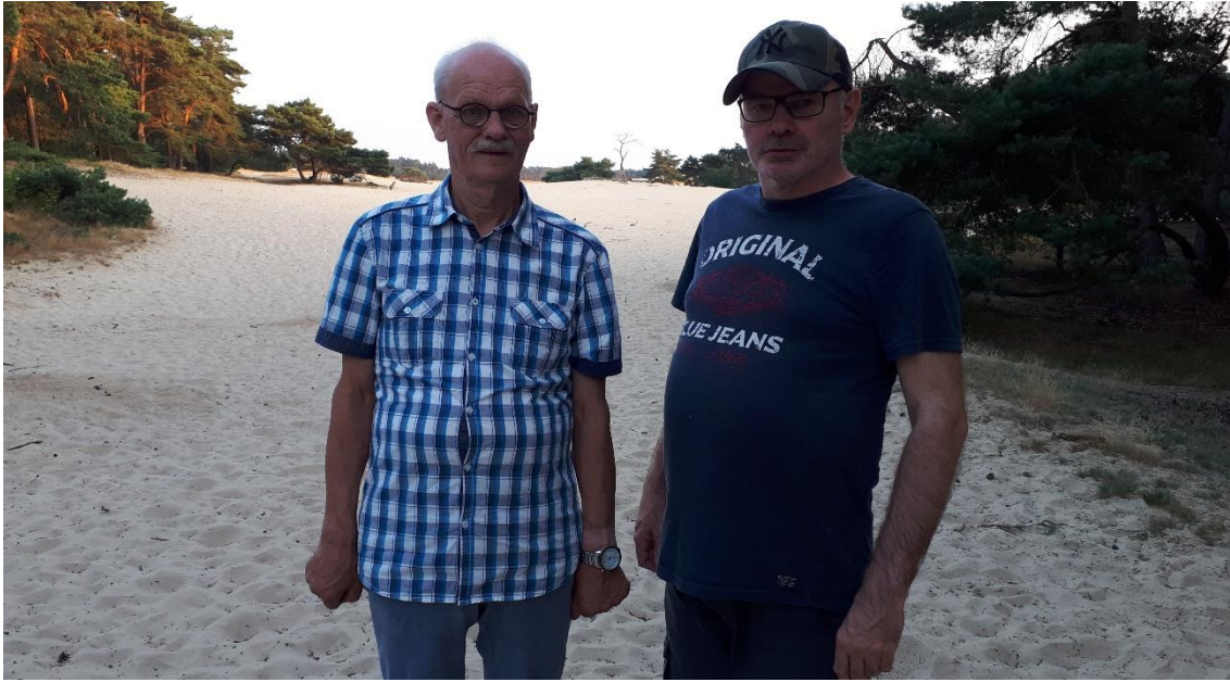
Bij de zandverstuiving