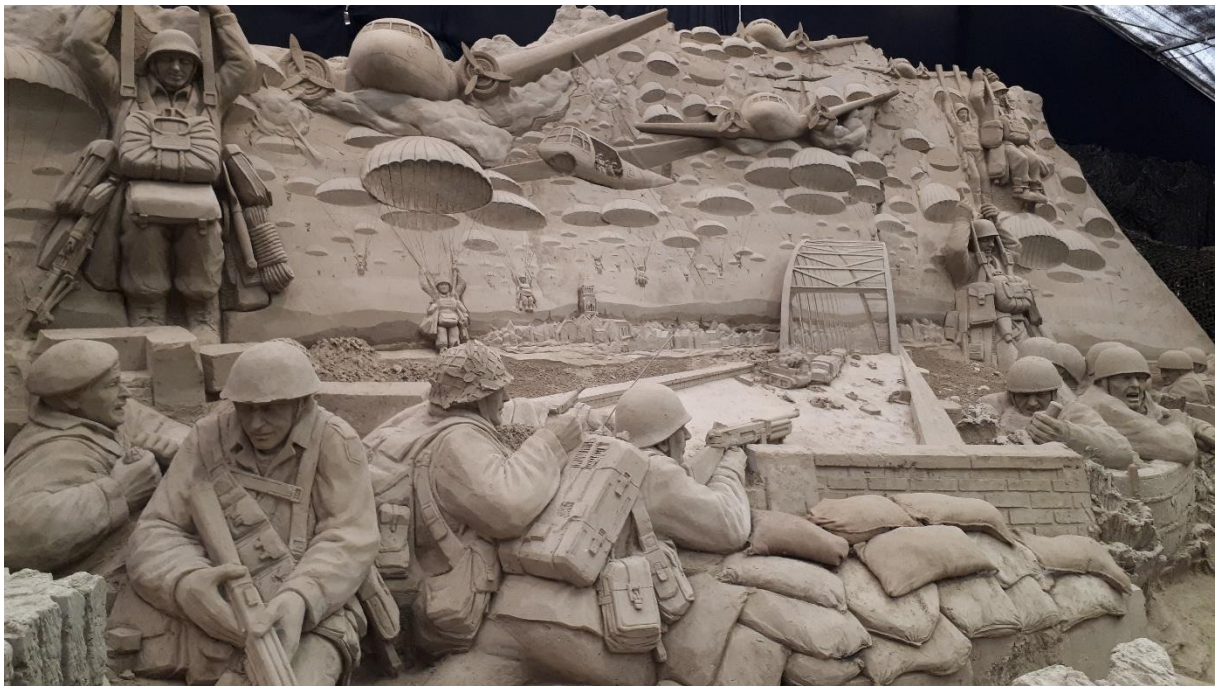
Slag om Arnhem