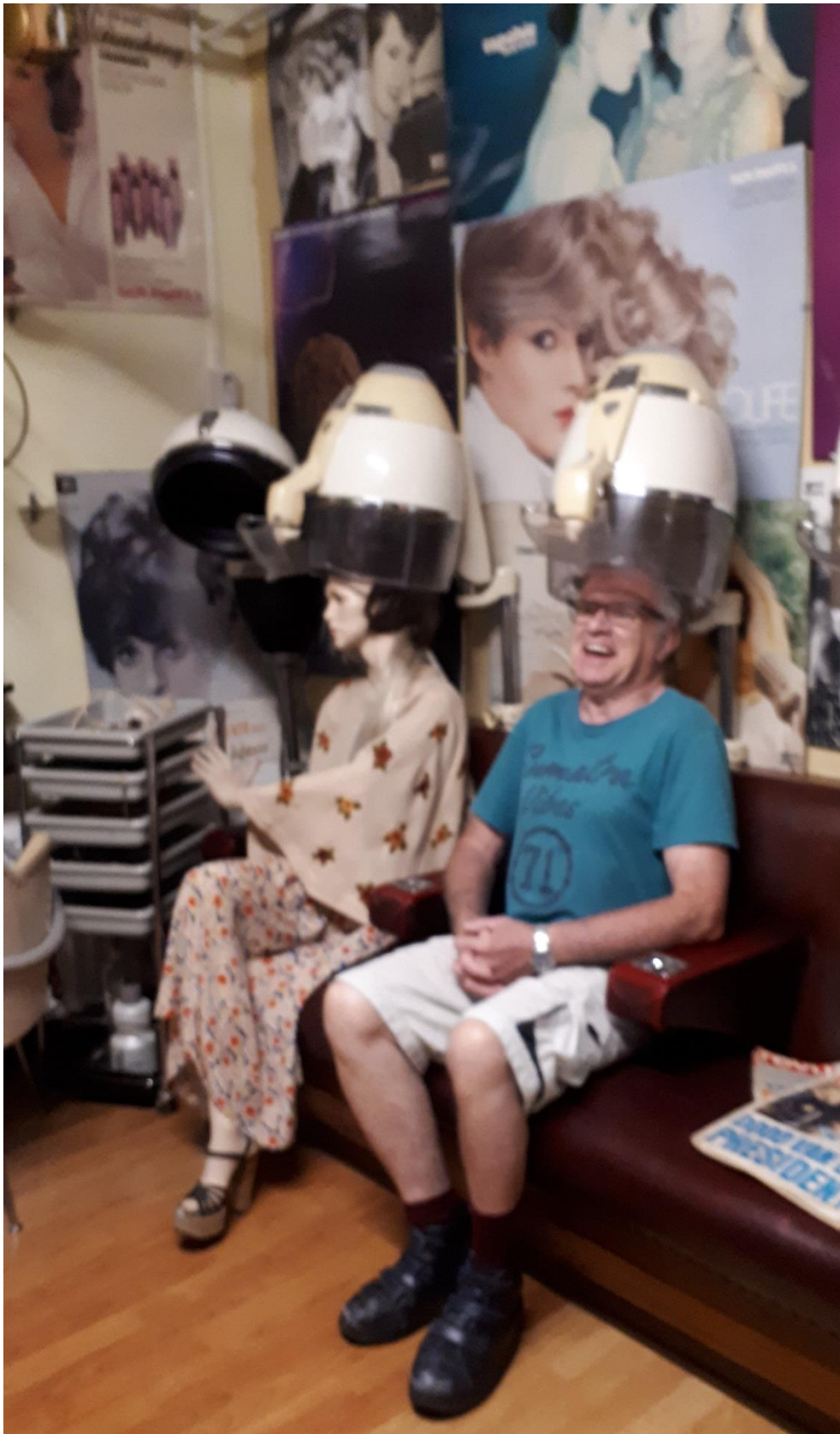
Eindelijk kon Fokke naar de kapper