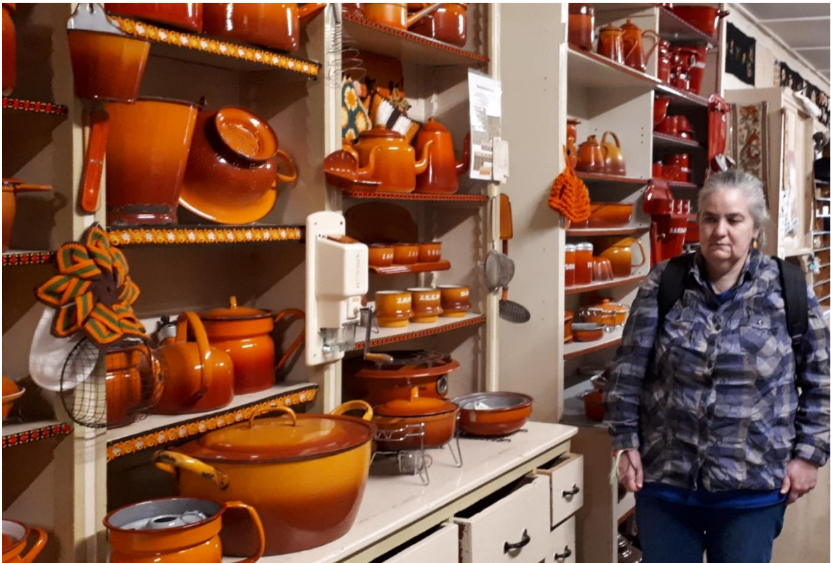
De oranje pannen van mama